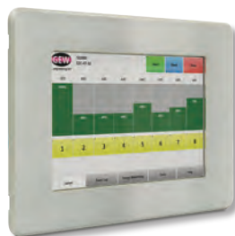
Panel dotykowy RHINO